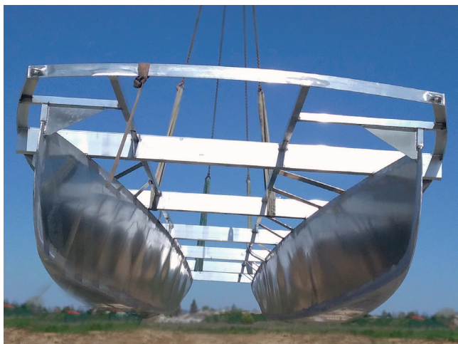
Les flotteurs sont en alu complètement recyclable, sans entretien.

La Nacelle : construite en Strongal (alu épais) par le célèbre METACHANTIER!